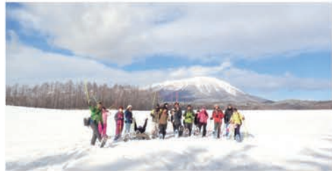
スノーシューウォーク体験

地域に住むあらゆる人々が、本人が望む地域に移り住み、もしくは暮らし続け、地域住民や多世代と交流しながら健康でアクティブな生活を送り、必要に応じて医療や介護・生活支援などのケアを受けることができるような地域。