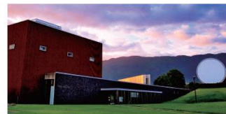
奈義町立図書館と奈義町現代美術館

「教育・文化のまちづくり監」に劇作家・演出家の平田オリザ氏を任命。小中学校では演劇を取り入れたコミュニケーション教育が行われています。